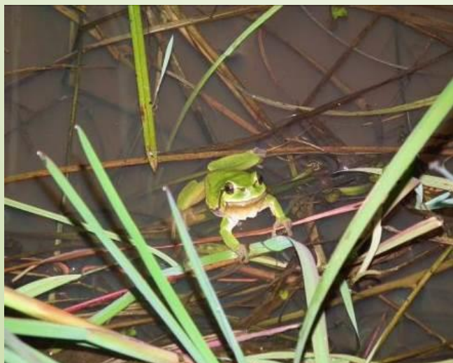
Rainette arboricole (MNE)

Le printemps et l' t  sont les saisons id ales. La zone humide recense plus de 120 esp ces de plantes, 4 esp ces d'amphibiens dont la Rainette arboricole et la Salamandre tachet e et de nombreuses esp ces de libellules et criquets dont le Criquet des roseaux et le criquet ensanglant . Des insectes xylophages prot g s sont pr sents dans les grands ch nes en p riph rie.