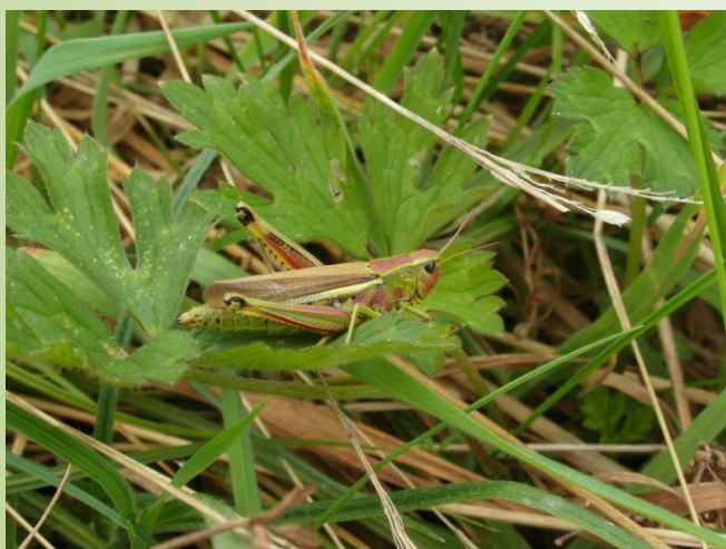
Criquet ensanglant  (O. Duval)