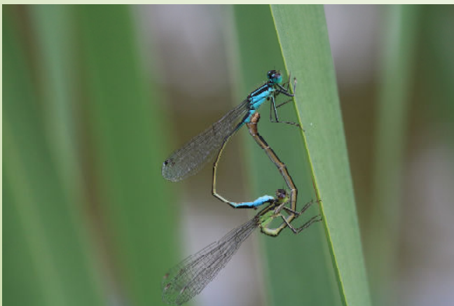
Agrion élégant (O. Duval)