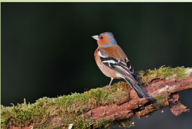
Pinson des arbres (R. Peillon)